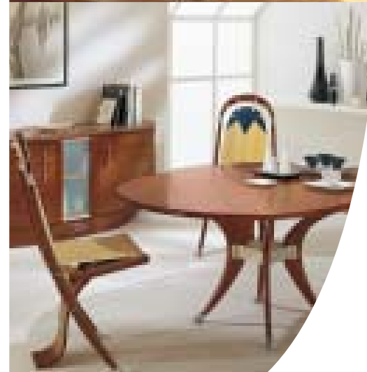
Table «Round Deck» Buffet 3 portes finition > Riviera

Réminiscence des vedettes des années 60, toujours synonyme de luxe, de farniente et de modernité, nos tables vernies se déclinent en plus de 15 références formes et dimensions : ronde, ovale, tonneau et maintenant rectangulaire et carrée dans la nouvelle gamme "Winch". Marqueterie d'essence fine avec alèses et piétement en bois massif sélectionné avec le plus grand soin pour sa provenance et sa qualité. Pour les amateurs de grand air, nous réalisons nos tables en teck de Birmanie avec des plateaux jointés élastomère afin d'évoluer en fonction des variations hygrométriques.