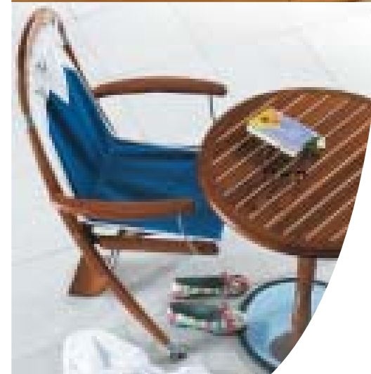
Fauteuil «Tribord» Table «Hublot» finition > Douka vernis