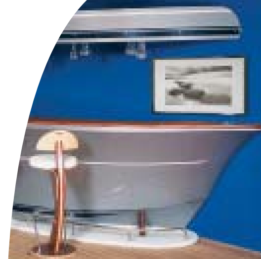
Comptoir 3 mètres avec ciel de bar

Hissez la grand voile... un vent de créativité ! *