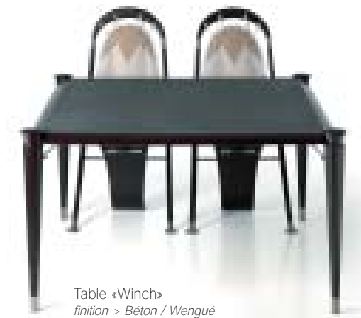
Table «Winch» finition > Béton / Wengué

Réminiscence des vedettes des années 60, toujours synonyme de luxe, de farniente et de modernité, nos tables vernies se déclinent en plus de 15 références formes et dimensions : ronde, ovale, tonneau et maintenant rectangulaire et carrée dans la nouvelle gamme "Winch". Marqueterie d'essence fine avec alèses et piétement en bois massif sélectionné avec le plus grand soin pour sa provenance et sa qualité. Pour les amateurs de grand air, nous réalisons nos tables en teck de Birmanie avec des plateaux jointés élastomère afin d'évoluer en fonction des variations hygrométriques.