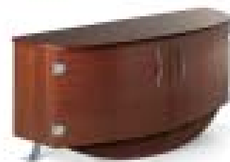
Buffet 2 portes «Riviera»

Pour l'intérieur ou l'extérieur, le comptoir "Grande Croisière" est synonyme de convivialité, il restera ancré dans la mémoire de vos convives ou de vos clients. Trois dimensions sont possibles (2, 3 ou 4 mètres), ainsi que de nombreuses options d'agencement intérieur.