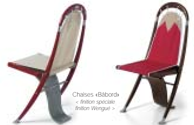
Chaises «Bâbord» < finition spéciale finition Wengué >

Le vent qui souffle dans les voiles exerce sur les cordages un effort de plusieurs tonnes alors, ne craignez pas de vous relaxer dans la toile des fauteuils «Spi».