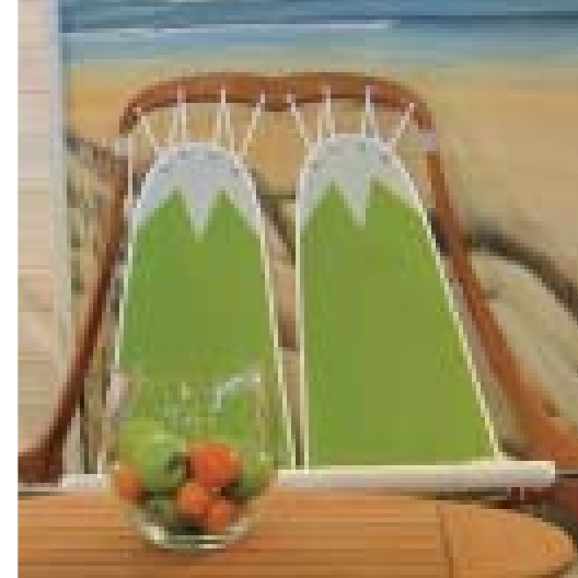
Duo «Spi» Table «Rouf Deck» finition > Teck naturel