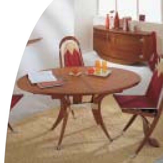
Table «Oval Deck» Buffet 2 portes finition > Riviera