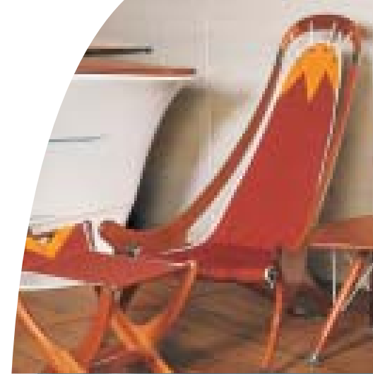
Ensemble «Spi» finition > Douka vernis Fauteuil, repose-pieds Table «Mini Deck»