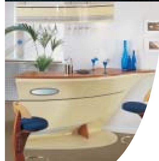
Comptoir 2 mètres avec ciel de bar